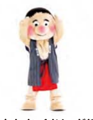
てまきくるくる 左から右へ手をくるくる回す