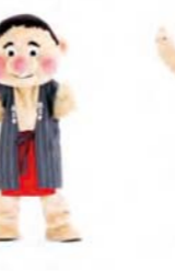
いつもたのしく ノリノリさー 足ぶみしながら 手をたたく