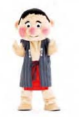
げんきの 手を2回曲げる