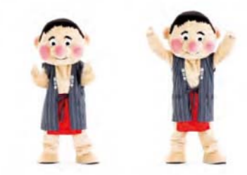
げんきもりもり 手を2回曲げる 手を上へのぼす