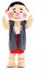
チョキ 手はチョキ