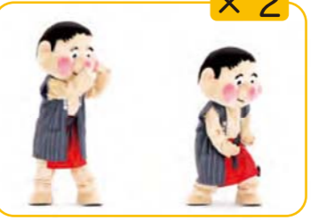
みの 手と左足を左なめ前に出し、手を下に ひっぱる 2回くりかえす