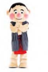
じゅもん 手を合わせて 忍者のポーズ