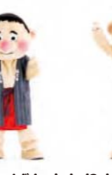
レッツ! ノリノリのりソング!