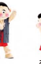
手と体をゆらし ながらしゃがむ