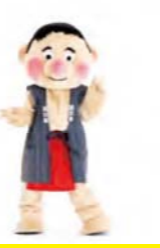
間奏 手はチョキにし、 右へ3歩