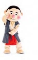
おにぎりにぎにぎ 大きなおにぎりをはにぎるポーズ