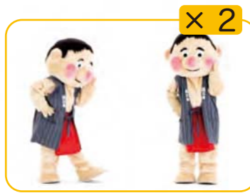
のりってえいようの たからばこなんだ 左手をほほに、左へ2歩