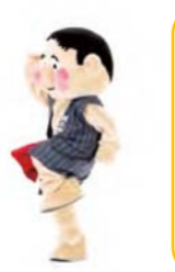
しゅっぱつだー 右手と左足をあげて かけあしのポーズ