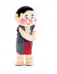
ノリノリ 手を組んで左へ