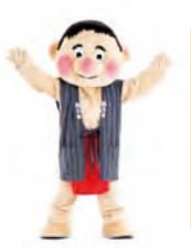
さあ 手を大きく広げる