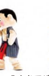
おしり ふりふり 右をむいて おしりをふる