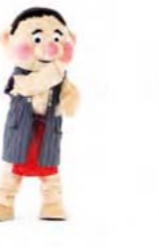
げんきもりもり 手を2回曲げる 手を上へのぼす