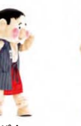
いつもたのしく ノリノリ 足ぶみしながら 手をたたく