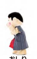
おしり ふりふり 右をむいて おしりをふる