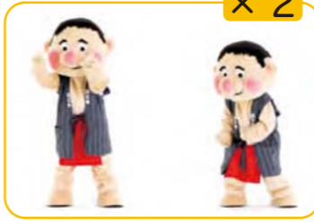
きょうはおたのし 手と右足を右なめ前に出し、手を 下にひっぱる 2回くりかえす