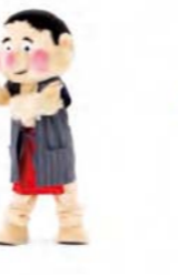
おしり ふりふり 右をむいて おしりをふる