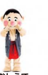
じゅもん 手を合わせて 忍者のポーズ