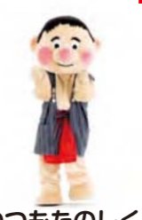
いつもたのしく ノリノリさー 足ぶみしながら 手をたたく