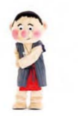
ジャンケン 手を組んで右へ