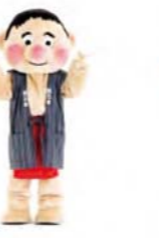
チョキ 手はチョキ