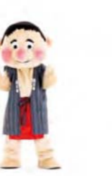
ジャンケン 手を組んで右へ