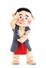
おにぎりにぎにぎ 大きなおにぎりをはにぎるポーズ