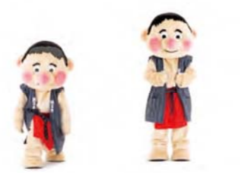
ピクニック 右足を前に出し、手を下からもちあげる