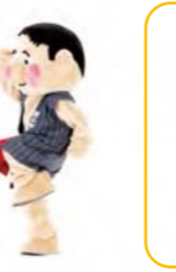
やったね! 右手と左足をあげて かけあしのポーズ