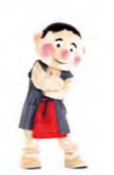
のりってごはんととって 腕をくんで左へ1歩