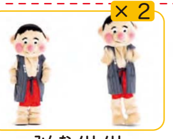
みんなノリノリ きょうもノリノリ 右へジャンプ 左へジャンプ 2回くりかえす