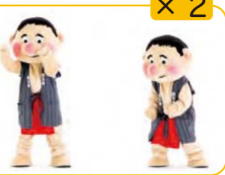
のりまきおにぎり 手と右足を右なめ前に出し、手を 下にひっぱる 2回くりかえす