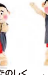
手を広げてジャンプ