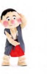
おすしまきまき 左から右へ手をくるくる回す