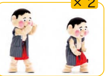
もって 手と左足を左なめ前に出し、手を 下にひっぱる 2回くりかえす