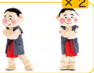
だってパパしてる? 腕をくんで右へ2歩