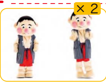
みんなノリノリ きょうもノリノリ 右へジャンプ 左へジャンプ 2回くりかえす