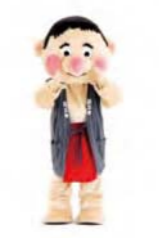
おしえて あげよ 手は口へ