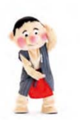
おすしまきまき 左から右へ手をくるくる回す