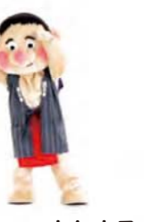
みんなでパクパク 左手は腰へ、右手は 食べるポーズ