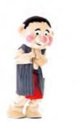
おしえて あげよ 手は口へ