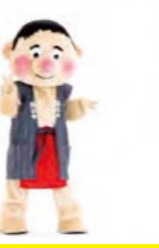
手はチョキにし、 左へ3歩