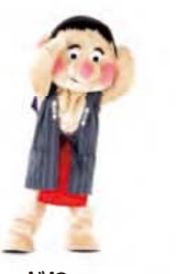
右手は腰へ、左手は 食べるポーズ