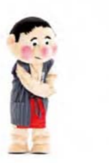
ノリノリ 手を組んで左へ