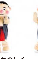
さんかくおにぎり 手を上にあげて 三角をつくる 2回くりかえす