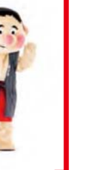
まんまるおにぎり 手を上にあげて丸を つくり、右へ傾く