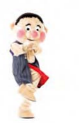
げんきの 手を2回曲げる