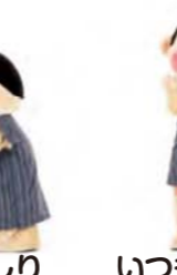
手を広げてジャンプ